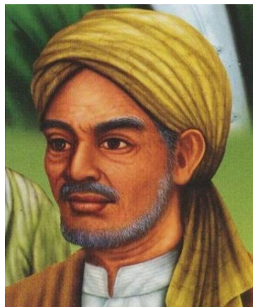
Hình 7. Maulana Malik Ibrahim "Sunan Gresik" Syeikh Jamadil Kubro. Vị truyền bá Islam nổi tiếng ở Champa.