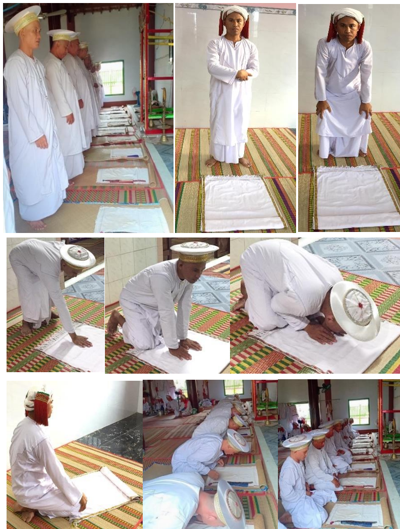
Hình 9. Giáo sĩ (Acar) đang thực hiện nghi thức cầu nguyện (Solat).

Cơ bản các bước Solat của Acar Bani Awal đều giống Bani Islam. Dưới đây, liệt kê một số động tác thực hiện trong Solat (cầu nguyện) của giáo sĩ (Acar) hệ phái Awal (Hồi giáo).