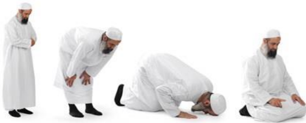
Hình 11. Tín đồ Hồi giáo (Bani Islam) thực hiện các bước cầu nguyện.