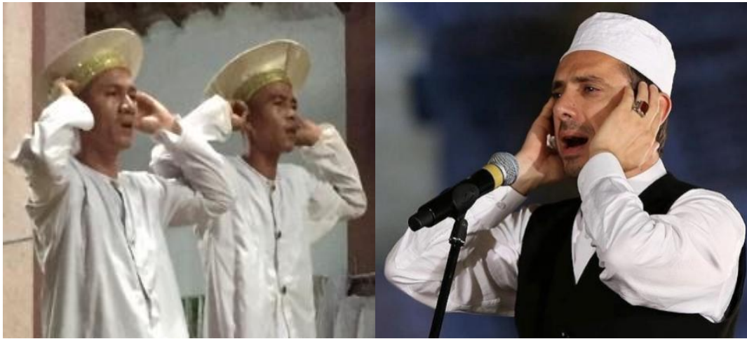
Hình 10. Giáo sĩ đang “bang” và “azan” thông báo giờ cầu nguyện giữa hệ phái Bani Awal và Bani Islam.

Theo luật định ta thấy những động tác rukun giữa Bani Awal và Bani Islam về thực hiện nghi thức Solat (Salah) thì hoàn toàn giống nhau.