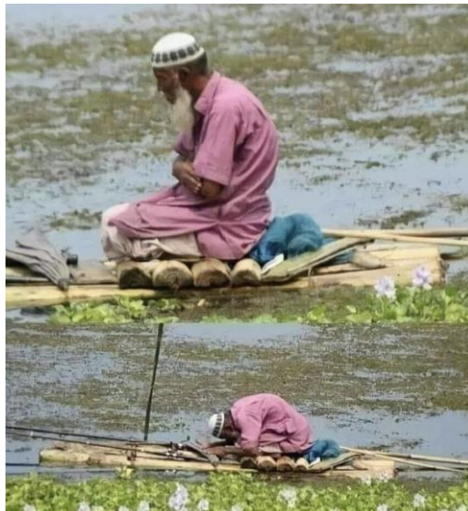
Hình 24. Một tín đồ cầu nguyện trên chiếc ghê làm bằng thân cây chuối.