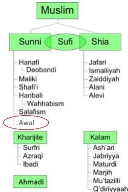
Hình 1. Awal: hệ phái Hồi giáo Champa. Awal nằm trong 73 nhánh, chỉ nhánh Islam trên thế giới.

Trong bài viết này, chỉ quan tâm đến tôn giáo Awal một hệ phái Islam thuộc dòng Sunni tại Champa. Xem Hình 1.